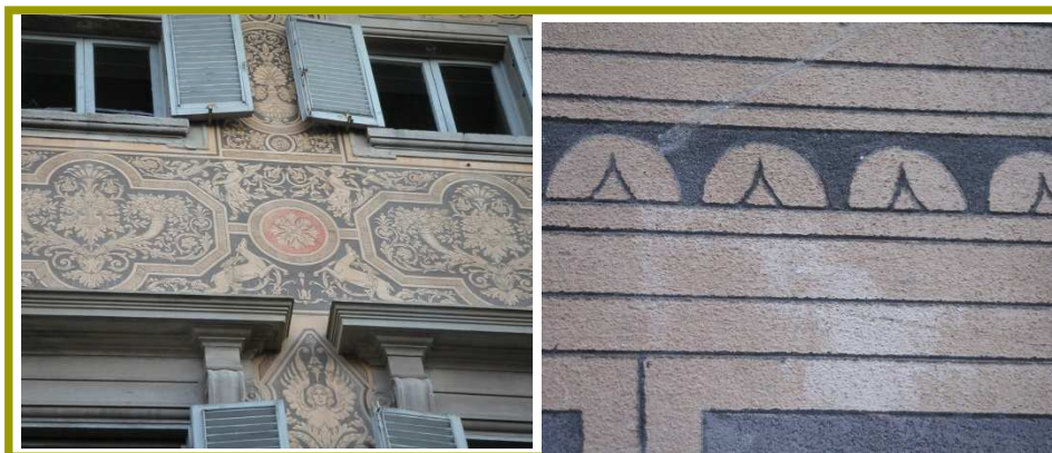
Une façade du XIX e siècle en sgraffito et vue de détail du mode d'incision

Téléphone : 05-63-33-23-76 Télécopie : 05-63-57-97-71 Messagerie : info@artematieres.com Web : www.artematieres.com N° SIRET : 45141681200027 Code APE : 8559A N° d'activité : 73.81.00677.81