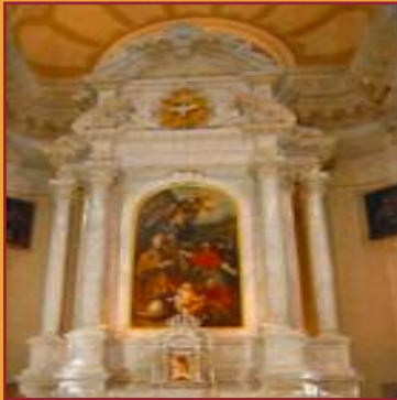
Le plus grand autel de la Cathédrale de San Martino, Tolmezzo (UD), 2007