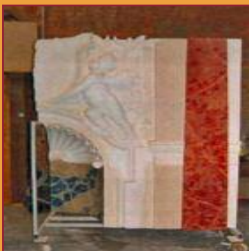
Palais Giardino Grande, Dresde 2007