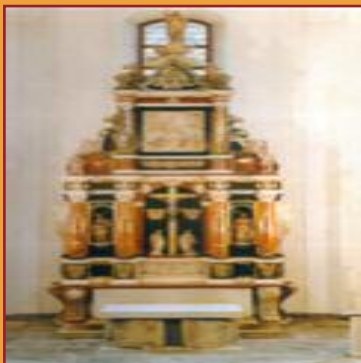
Autel de Nossen (1606) Paroisse évangélique-luthérienne de Dresde-Loschwitz. Monuments his- toriques de Sassonia - 1999-2002