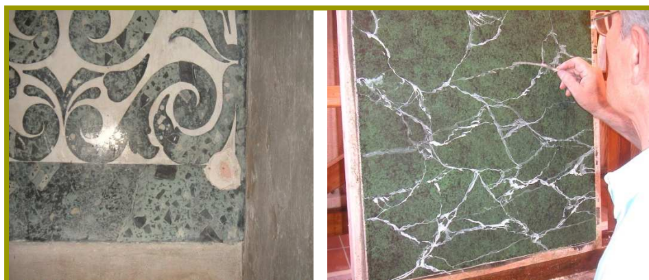
Stuc marmorino du XIII e siècle à Venise

Téléphone : 05-63-33-23-76 Télécopie : 05-63-57-97-71 Messagerie : info@artematieres.com Web : www.artematieres.com N° SIRET : 45141681200027 Code APE : 8559A N° d'activité : 73.81.00677.81