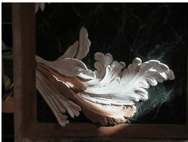
Stuc marmorino en relief