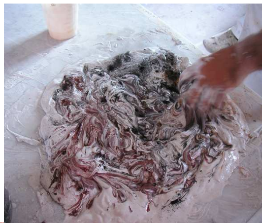
Mélange des pâtes et pigments.