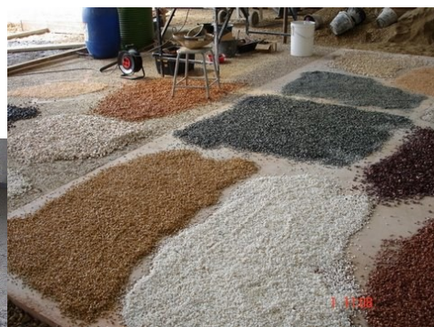
Sélection des granulats et damage dans la chape fraîche.

Nous nous réservons le droit d'annuler l'atelier si le nombre de participants n'était pas suffisant. Les acomptes seront remboursés ou reportés sur une autre session